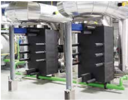
Den neuen Eisspeicheranlagen in der neuen Energiezentrale sind Plattenwärmetauscher zur Vorkühlung vorgeschaltet