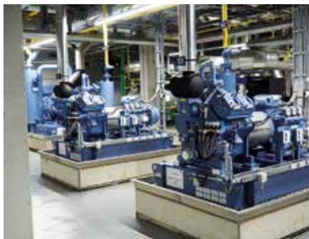
Naarmanns neues KWKK-Konzept arbeitet mit einem COP von 0,5 bei der Wandlung von Wärme in Kälte und mit ca. 3,3 bei der Wandlung von Strom in Kälte

Bei Naarmann wird der Niedertemperaturfluss aus den BHKWs, d.h. die thermische Energie aus dem Motorkühlwasser, in der Absorptionskälteanlage genutzt, die Abgaswärme wird über einen Abhitzekeessel in Dampf umgesetzt – für den der auf Sterilprodukte ausgelegte Betrieb entsprechenden Bedarf hat. Die Grundversorgung mit Wärme übernimmt klassisch ein Dampfkessel auf dem Betriebsgelände. Dort steht seit 2014 auch das erste von Naarmann installierte BHKW. Das erwärmte Eis/Kaltwasser kommt aus dem Betrieb über eine Rohrbrücke in NW 200 in die Energiezentrale. Dort wird es einem 17 m 3 Puffertank zugeführt, aus dem die Absorptionskältemaschine gespeist wird. Sie verringert im Prinzip autark geregelt die Kältebelastung in der Vorkühlung.