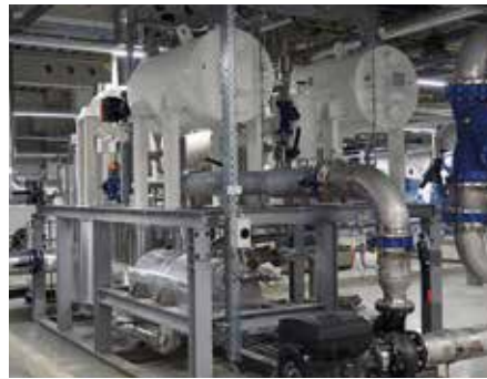
Bildet das Herz des neuen KWKK-Konzept bei Naarmann: die Absorptionskältemaschine von AKM